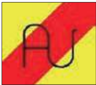
Hermanos Ustarroz (Arguedas)

9:30-10:30: Vaquillas en la plaza 10:30-11:00: Encierro 17:30-17:45: Presentación RecoArte 17:45-18:45: Exhibición RecoArte 18:45-19:30: Prueba de ganado en la plaza 19:30-20:30: Encierro